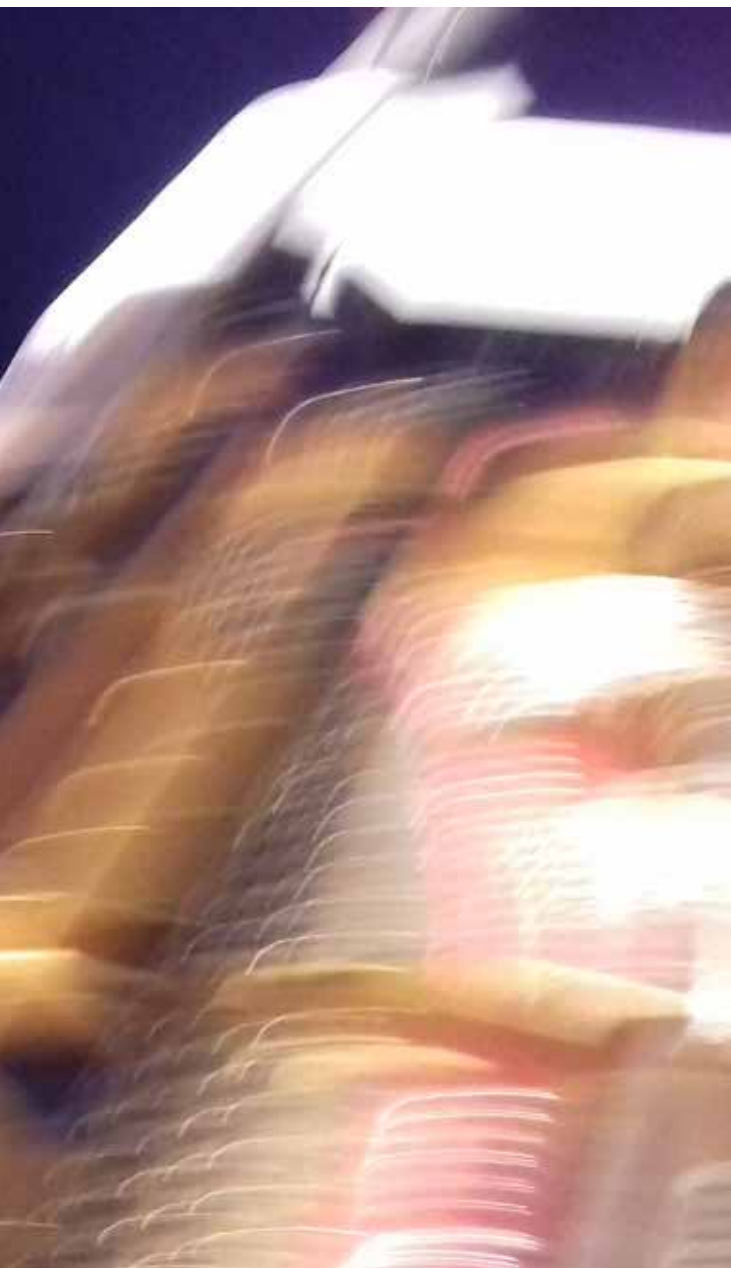
COULEUR·S SOLO

SOUTIEN FINANCIER CONSEIL DÉPARTEMENTAL DE MEURTHE ET MOSELLE CÉSARÉ, CENTRE NATIONAL DE CRÉATION MUSICALE DE REIMS DRAC GRAND-EST RÉGION GRAND-EST